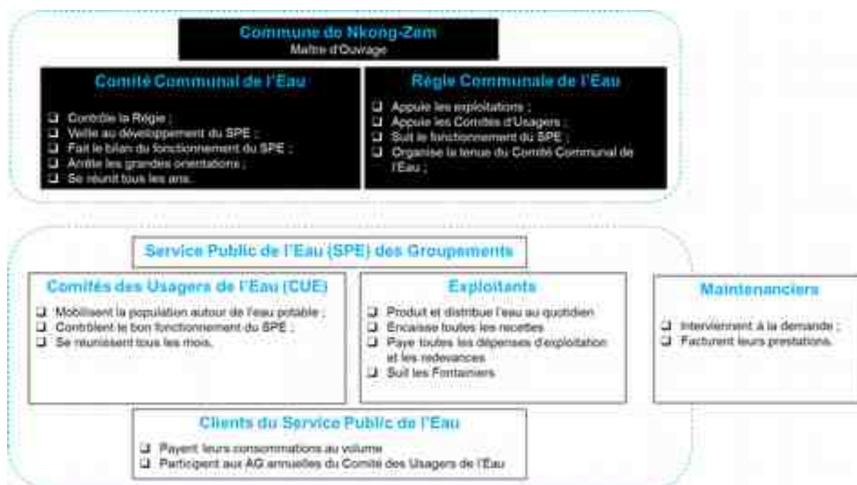
Schéma synthétique du Service Public de l'Eau à mettre en œuvre sur le projet SCAN Water de Folewi / Baletet