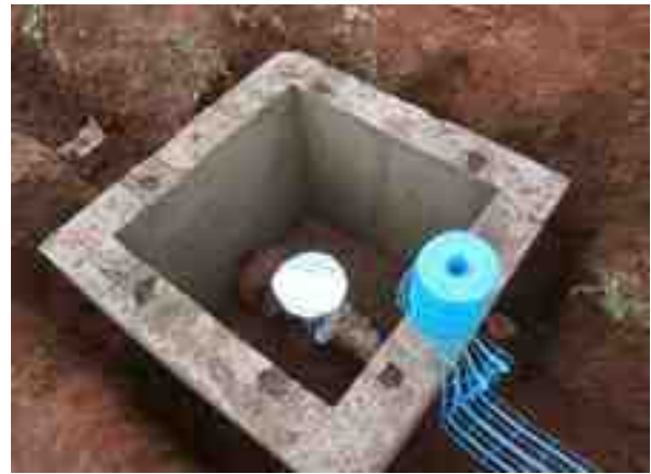
Canalisation de distribution en cours de pose / Construction d'un regard de sécurisation de compteur de sectorisation