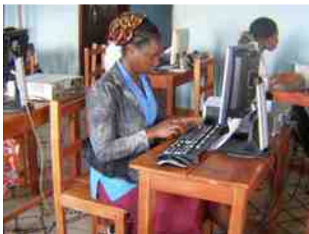
Une attitude de notre candidate en Salle d'examen du DQP; Phase pratique secrétariat Bureautique