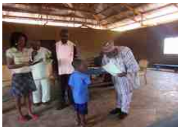
Visite du délégué départemental à l'école