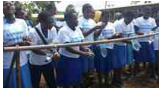
L'animatrice en cours de sensibilisation dans un établissement scolaire primaire (haut) et secondaire (bas) / Sensibilisation dans les établissements scolaire lors de la journée mondiale du lavage des mains au savon.