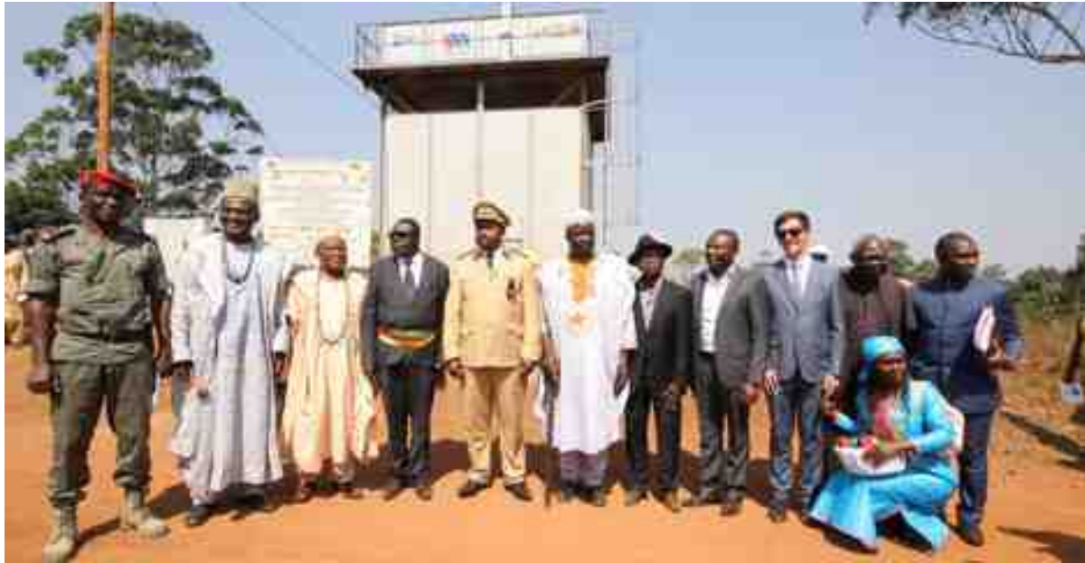
Autorités officielles et traditionnelles lors de la cérémonie d'inauguration