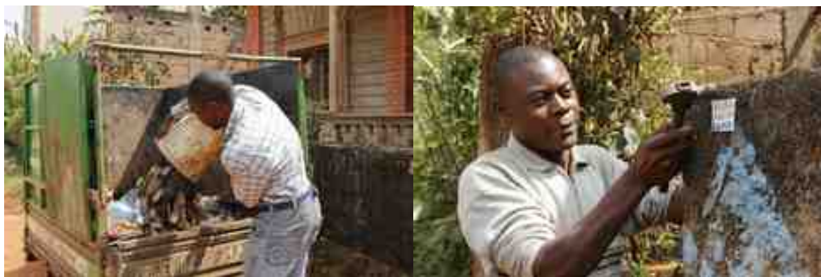
Journée de collecte des déchets à Dschang, et inscription de nouveaux abonnés.