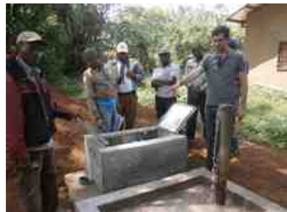
Réception provisoire de la 1 ère phase des travaux / Réception technique de la 2 ème phase des travaux