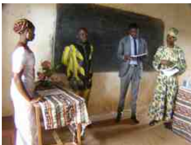
Le mot du Jury après soutenance