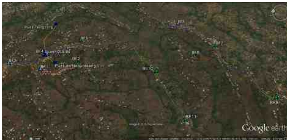
Visualisation Google Earth des travaux de réhabilitation du système d'eau potable ScanWater de Folewi / Baletet