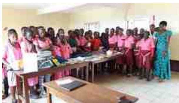
Les classes de l'année scolaire 2016 – 2017.