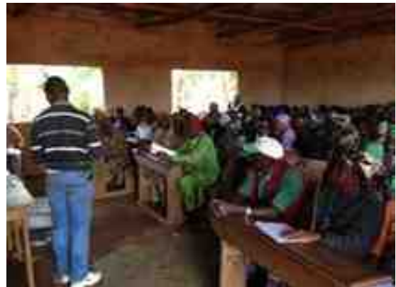
Sensibilisation des autorités traditionnelles de Baletet au principe de Service Public de l'Eau par l'expert / Tenu de l'assemblée générale du Comité des Usagers de l'Eau de Folewi Baletet