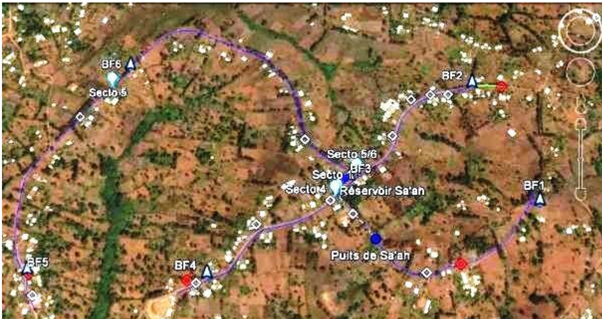
Figure 1: Localisation des compteurs de sectorisation et des Bornes fontaines sur le réseau de Sa'ah Batsingla

réseau AEP). Le 9 Décembre 2013 a eu lieu la réception définitive des ouvrages en présence du VSI ELANS, du GICAPBAF et du maitre d'œuvre sollicité en 2012 (entreprise NSEGBE) (voir ANNEXE 1 pour le journal de bord).