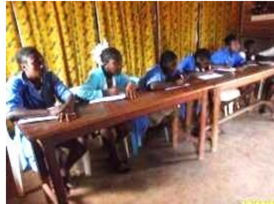
Figure 5: Débats et soutien scolaire à la MJC