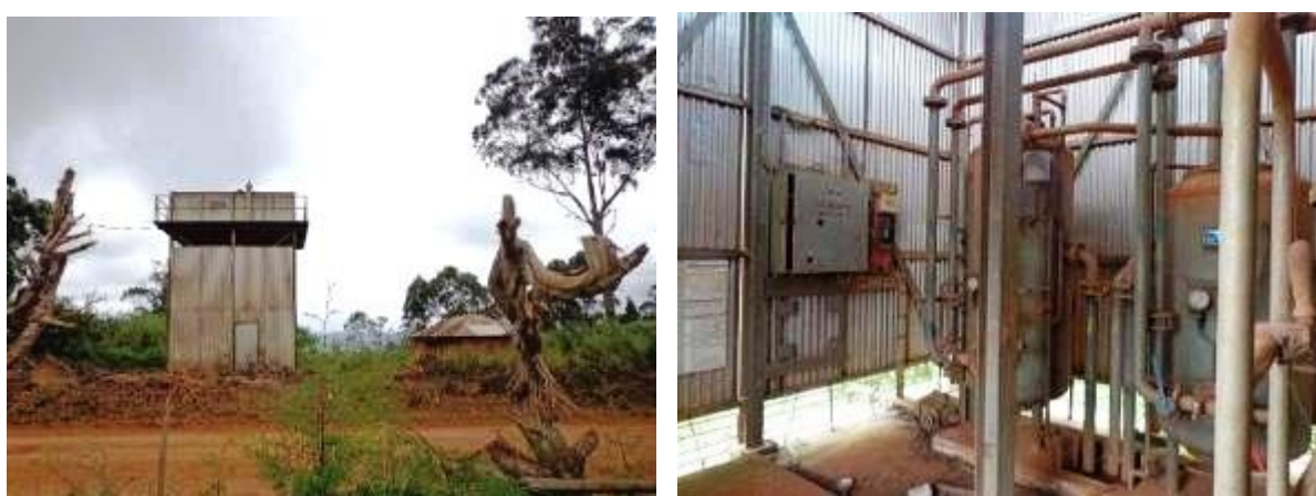
Figure 3: Réservoir SCAN Water de Folewi – Baletet / filtre à sable à l'intérieur du local technique