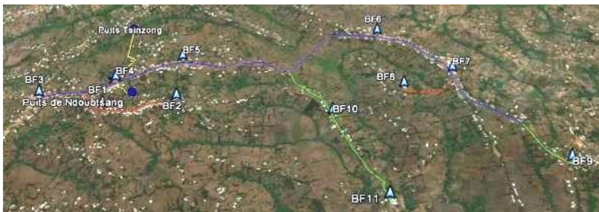
Figure 2: Vue d'ensemble du projet de réhabilitation du réseau SCAN Water de Folewi / Baletet