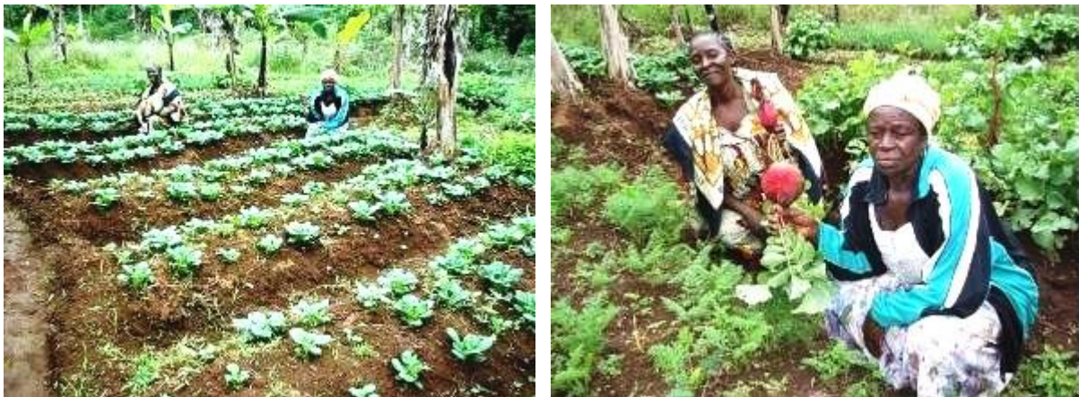
Figure 8: Carottes, radis et choux chinois cultivés grâce au compost