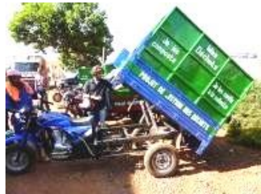
Figure 6: Pré-collecte à Dschang et Acquisition de 4 motos-tricycles qui collectent les déchets et sensibilisent en même temps les populations.