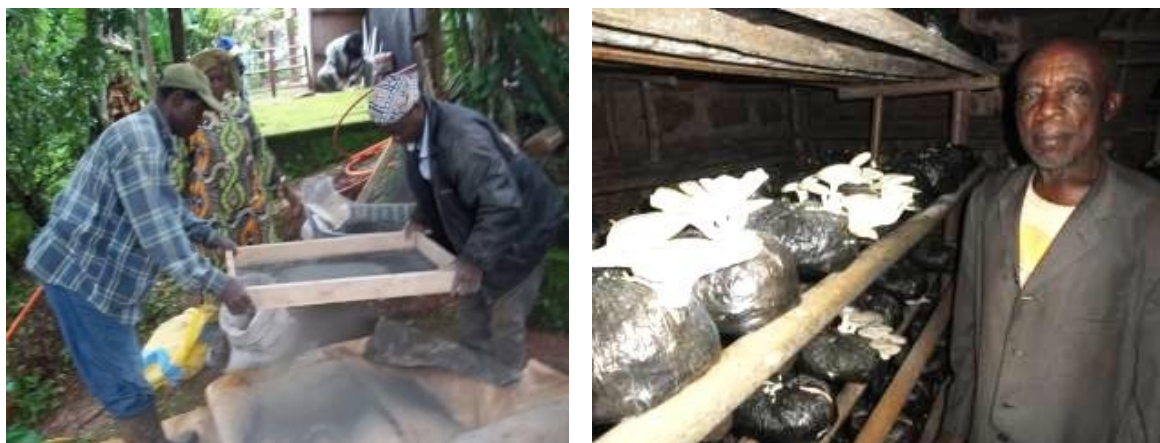
Figure 9: activités des APC

Le suivi et la formation des APC s'est poursuivi alors que de nouvelles activités ont été créées tandis que d'autres ont dû être entérinées (voir ANNEXE 1 pour le Journal de bord).